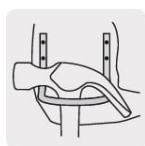
Gancho de acero para martillo